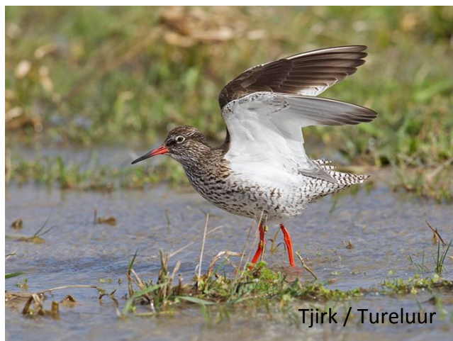
Tjirk / Tureluur